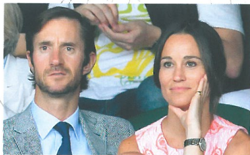
James e Pippa spettatori a Wimbledon.