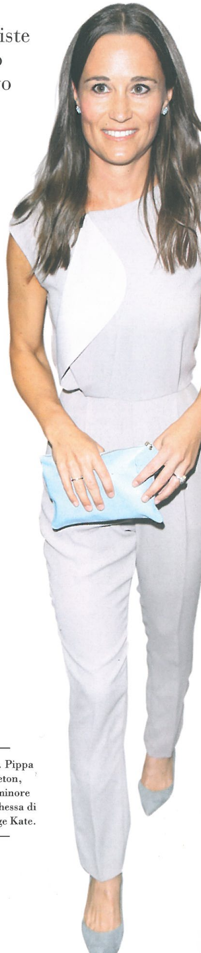
A destra. Pippa Middleton, sorella minore della duchessa di Cambridge Kate.