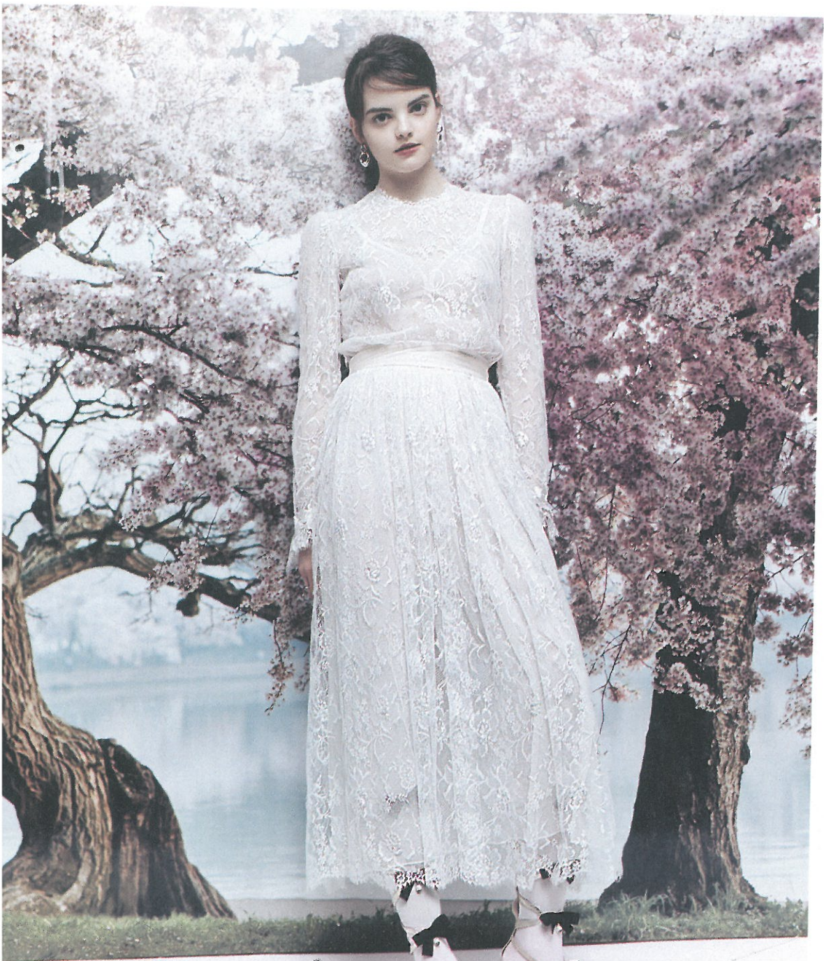
abito longuette in pizzo Le Spose di Giò , orecchini Sharra Pagano , scarpe in pelle craquelé con fiocchi Gucci . A sinistra, abito in garza e organza Antonio Riva , orecchini Sharra Pagano , girocollo in oro con brillante Salvini . A destra, abito in garza e organza Antonio Riva .